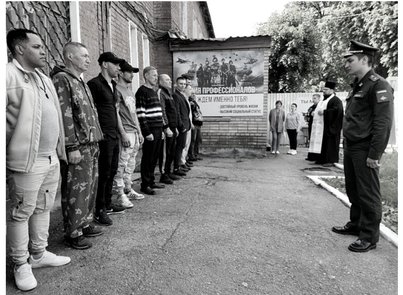
Ciudadanos cubanos, junto a otros de diferentes nacionalidades, se unen al ejército ruso

También la Universidad de La Habana, principal centro de educación superior en Cuba, firmó un convenio de colaboración con el canal Rusia Today, principal medio de propaganda rusa, a quien el mandatario cubano Miguel Díaz-Canel ofreció una entrevista en la que defendió este proceso de acercamiento.