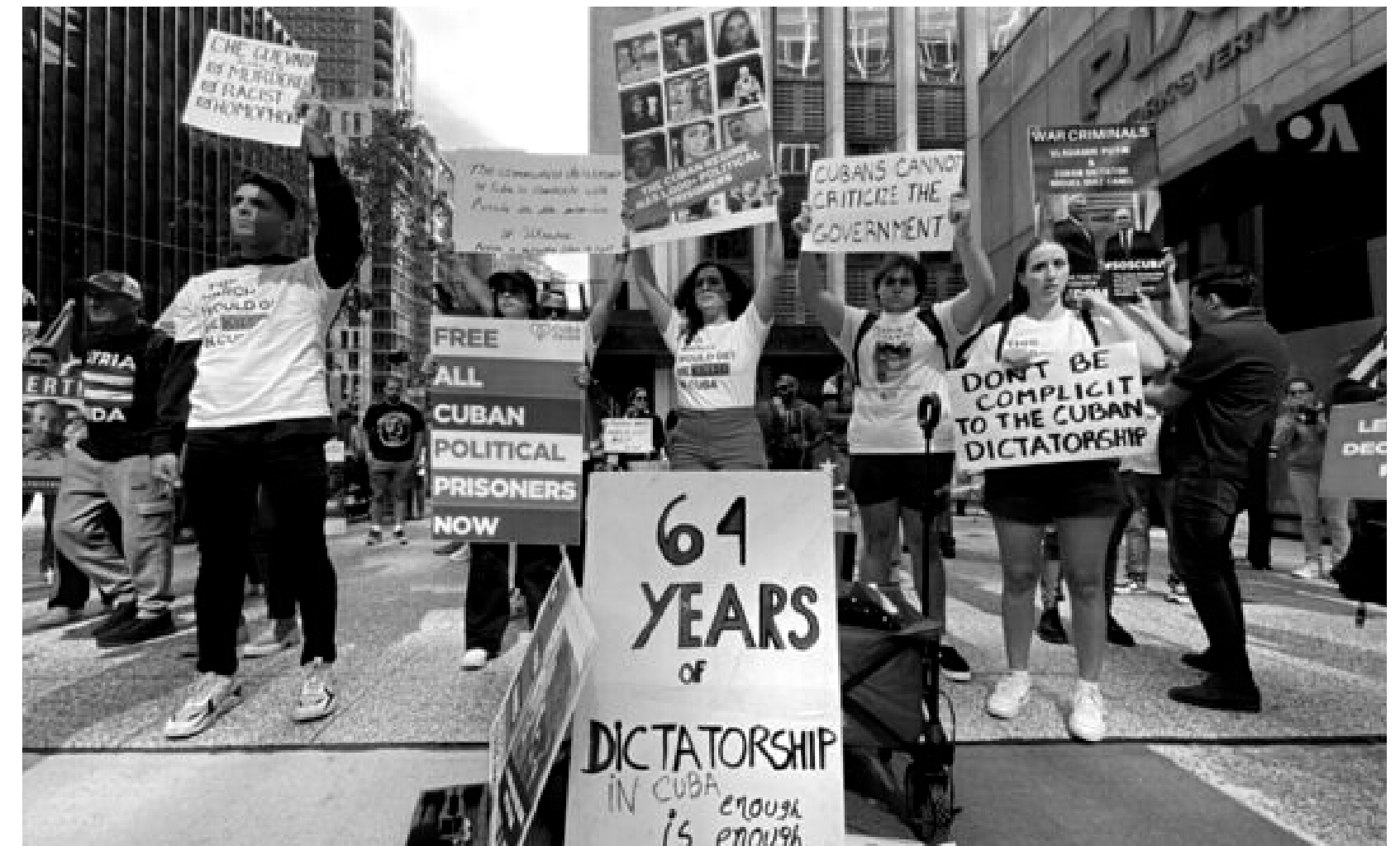
Cubanos protestan en New York por la presencia de Díaz-Canel.

Pocos días después de la visita, que fue repudiada in situ de manera pacífica por exiliados cubanos, la cancillería de la Isla denunció un ataque con cocteles molotov a la sede de la embajada en Washington, que no causaron daños .