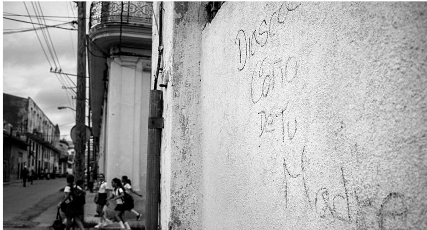
Pintada contra Díaz-Canel en La Habana.