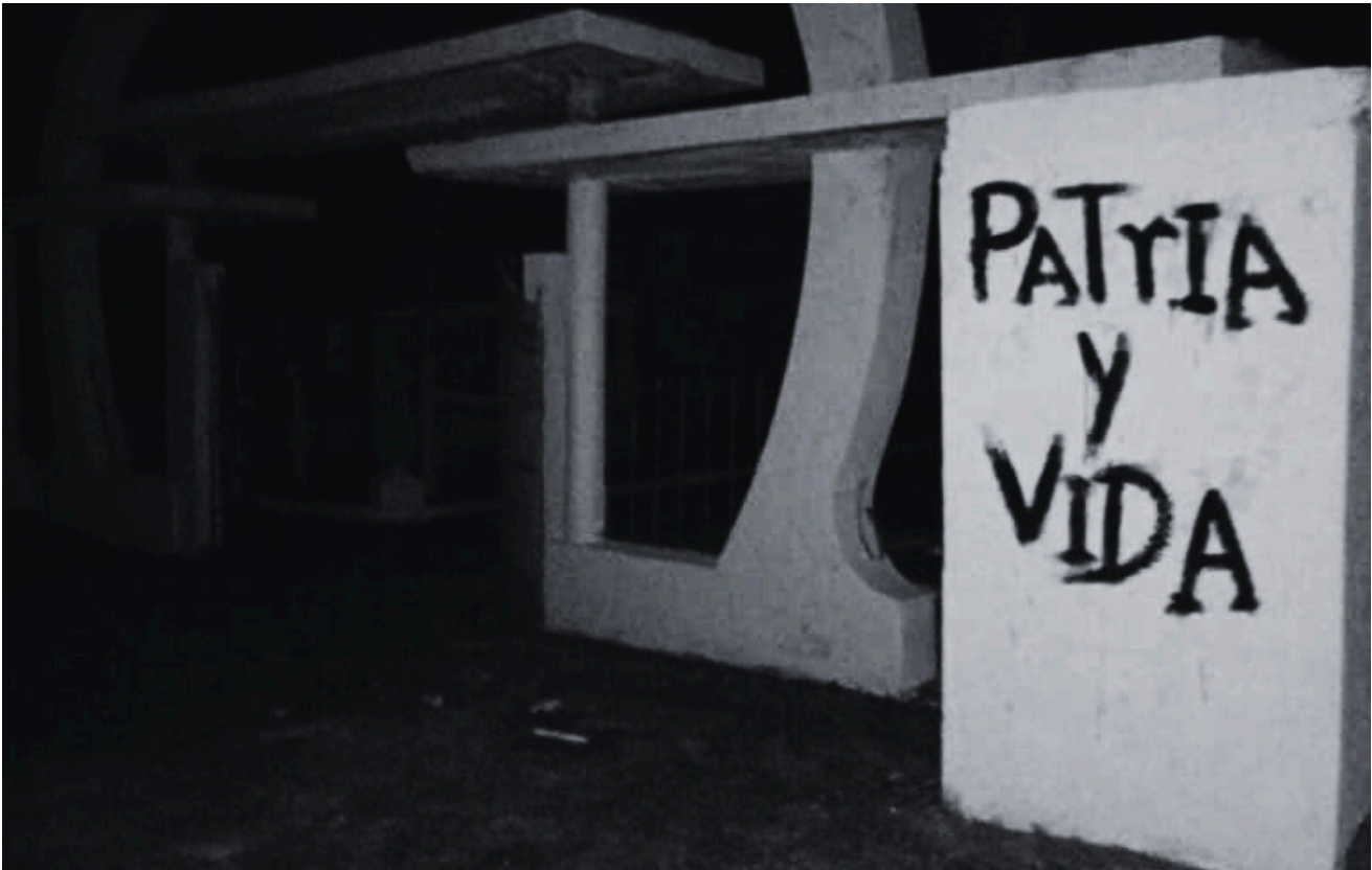
FOTO: CARTEL CON LA FRASE “PATRIA Y VIDA” A LA ENTRADA DEL CEMENTERIO DE SAN ANTONIO DE LOS BAÑOS.

Durante el mes se registraron varias protestas espontáneas motivadas por los apagones, la falta de agua, el colapso sanitario y el abandono luego del paso del huracán Melissa. Las formas de manifestación incluyen cacerolazos , cierre de calles , carteles , quema de basura , concentraciones en espacios públicos y protestas ante autoridades .