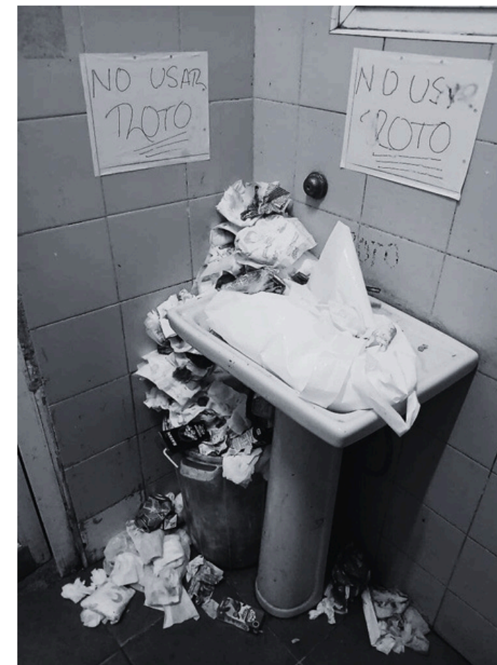
FOTO: BAÑO DEL HOSPITAL MATERNO DE CAMAGÜEY. FUENTE: JOSÉ LUIS TAN ESTRADA/FACEBOOK.

El aparato gubernamental anunció que se mantienen las medidas de eliminación de los pocos e insuficientes subsidios que aún existen, aunque estas se postergaron debido a la .