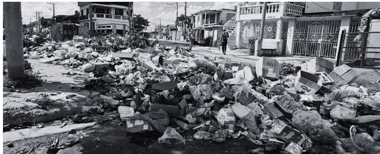
FOTO: BASURERO EN LA CIUDAD DE CAMAGÜEY.

Una de las áreas en la que más repercuten los apagones, junto al colapso de los servicios de recogida de basura , es en la proliferación de las arbovirosis transmitidas por mosquitos. Aunque las autoridades sanitarias hablan de control de la epidemia y solo informan de 50 mil contagios y 55 fallecidos , las denuncias provenientes de la ciudadanía e informes de organizaciones internacionales muestran un cuadro mucho más extendido, letal y complejo. Son frecuentes los reportes de contagios de turistas que visitan la Isla y varios países han emitido alertas a sus nacionales sobre los viajes a Cuba. Todo esto, con un sistema de salud en crisis, donde escasea el personal , los medicamentos e insumos , las infraestructuras se encuentran en estado calamitoso y la atención es mala .